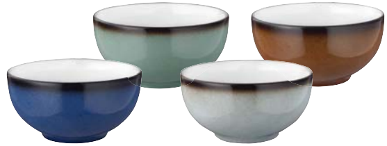
»Royalblau« 57122 »Türkis« 57123 »Grau« 57124 »Caramel« 57125

»ELIXIR OF LIFE« in form and colour For practical aesthetes... It has become synonymous with our times – central to life, assisting restaurateurs in their varied tasks. It needs to work. It needs to be ready for every task. It also needs to give each and every guest the »feeling« that he could try this in his own home – and savour something really special. And it's earned its name, because it does its job so well: COUP FINE DINING Fantastic